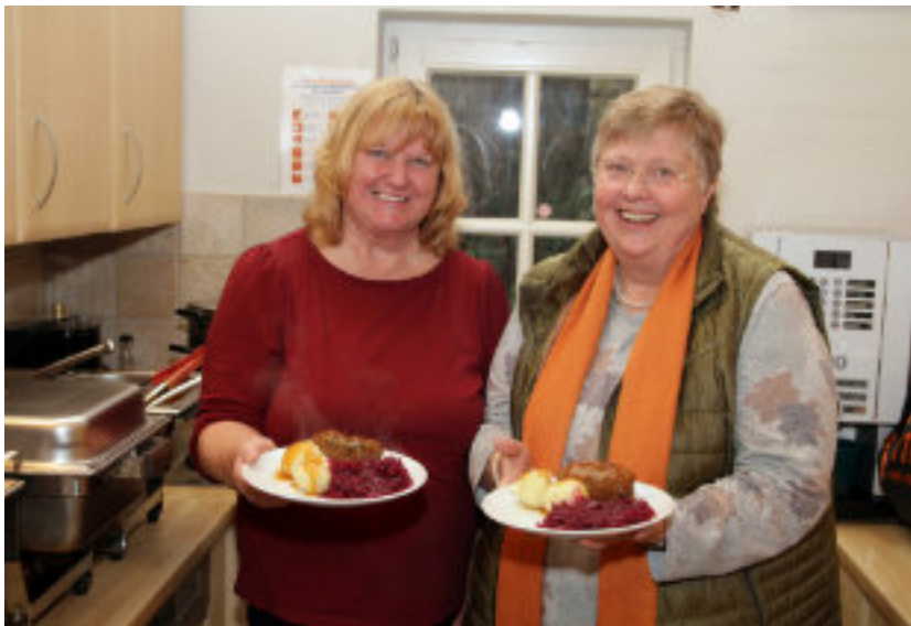
Ehrenamtliche servieren bei der Heiligabendfeier für alleinstehende Seniorinnen und Senioren im Teehaus Gerthe leckeres Essen.