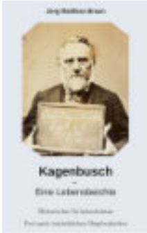
Buchcover des historischen Romans