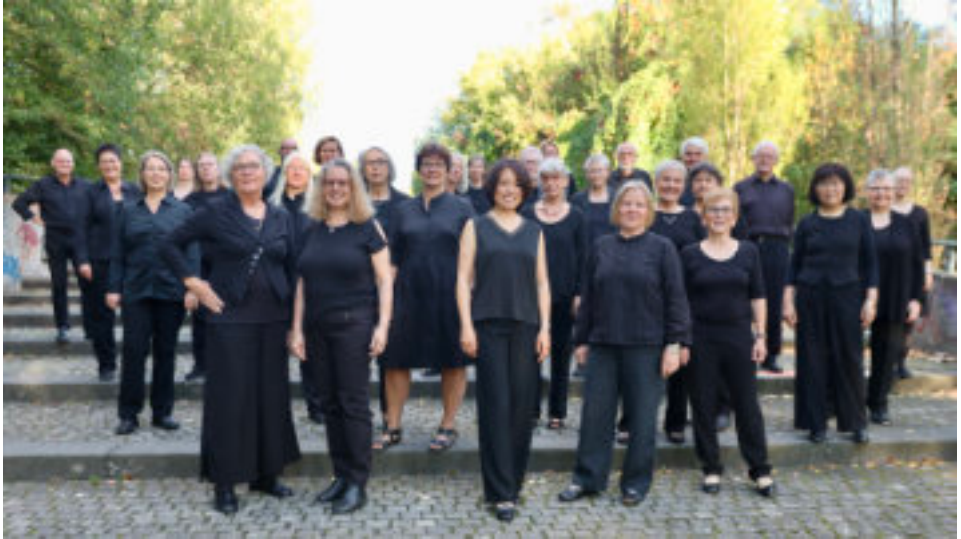
Der Neue Chor der Stadt Bochum e. V.